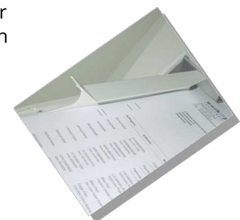
Strichcode auf einem Anschreiben